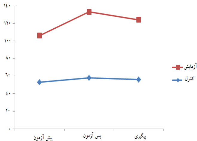
نمودار شماره ۱: تأثیر تعامل گروه در زمان بر عملکرد جنسی زوجین

جهت نمایش میانگین نمرات صمیمیت زوجین در ۳ مقطع مختلف و به تفکیک دو گروه آزمایش و کنترل نمودار شماره ۱ ارائه شده است. همان گونه که از این نمودار نمایان است، میانگین عملکرد جنسی آزمودنی ها با اثری خطی (همگام با مداخله) در حال افزایش است. در حالی که میانگین نمره گروه کنترل در ۳ مقطع مورد سنجش تقریباً ثابت باقیمانده است. همان طور که در نمودار مشاهده می شود، میانگین نمرات بین ۳ بار اندازه گیری گزارش شده در طول زمان، به لحاظ آماری تفاوت معنی داری را نشان می دهند ( P < 0/01 , F=161/79 ). نتایج به دست آمده حاکی از این است که در هر دو گروه در طول زمان تفاوت وجود دارد (اثر زمان)، اما این اثرات به گونه متفاوتی رخ داده است؛